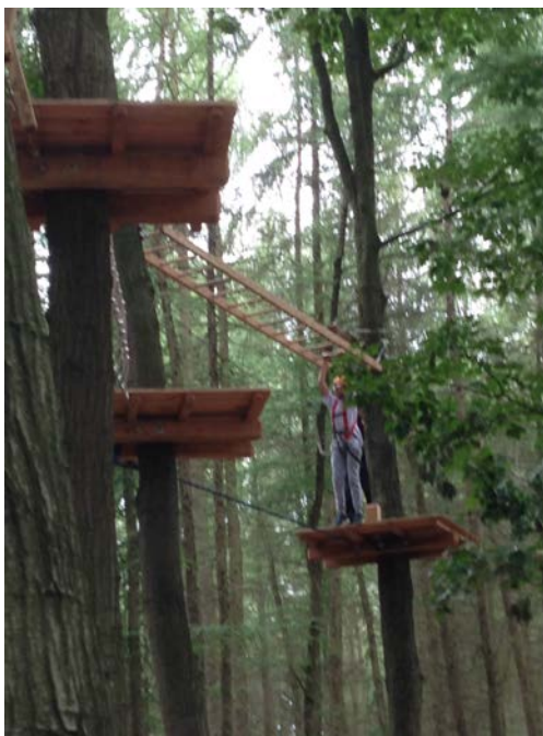
Parcours 'De Rooverische Leij'

Correspondentieadres: EETSJ OUTDOOR p/a Brembos 22 4854 KZ BAvel Tel 06- 51861628 meijssen1@xs4all.nl www.eetsj-outdoor.nl IBAN NL RABO0123287278