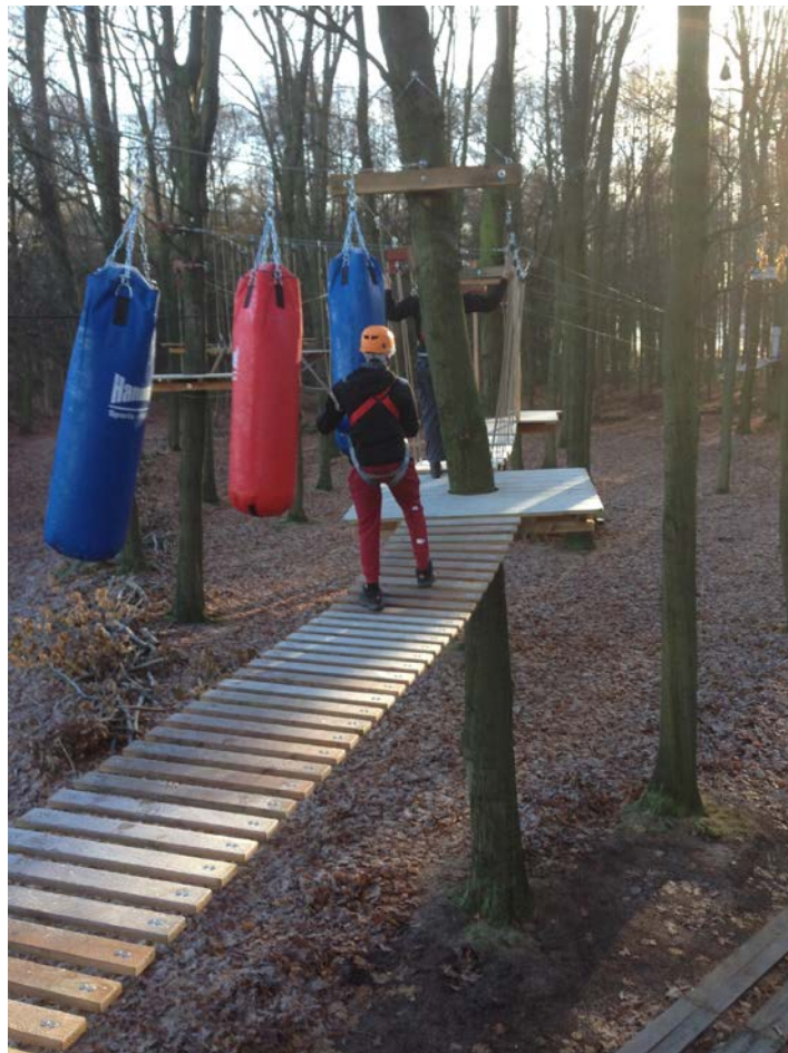
'De Rooversche Leij'

Het bestuur heeft in de periode daarna met regelmaat (intern en extern) overlegd om te bezien op welke wijze de beschikbare middelen (financiën, inventaris en kennis) ingezet konden worden om onze doelstellingen alsnog te realiseren. Niet in de laatste plaats zijn dat: de toeleiding naar, al dan niet betaalde, arbeid en de ontmoeting tussen mensen met een beperking en anderen.