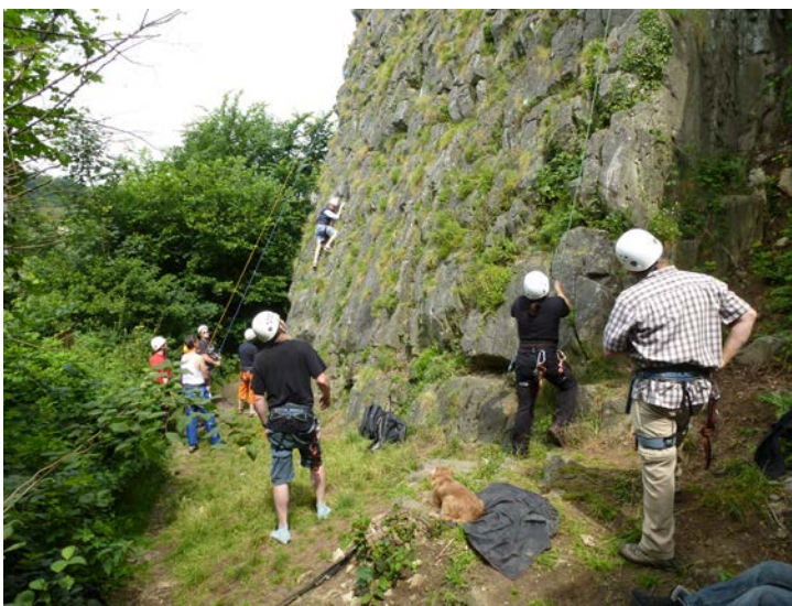
Buitensport weekend 2016

De in 2016 ontvangen giften ad. € 22.830,- staan gespecificeerd in de bijlage.