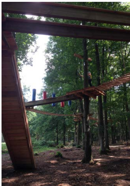
De Rooverische Leij”